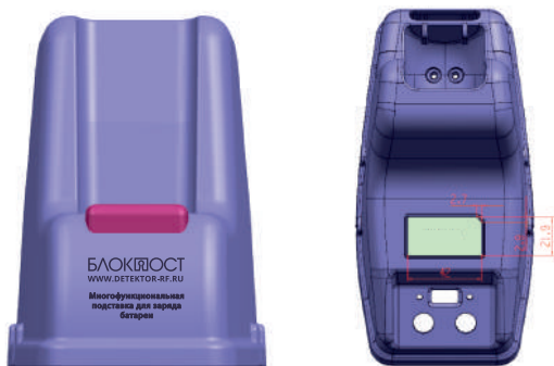
Рисунок 3 – Схема подставки для заряда батареи