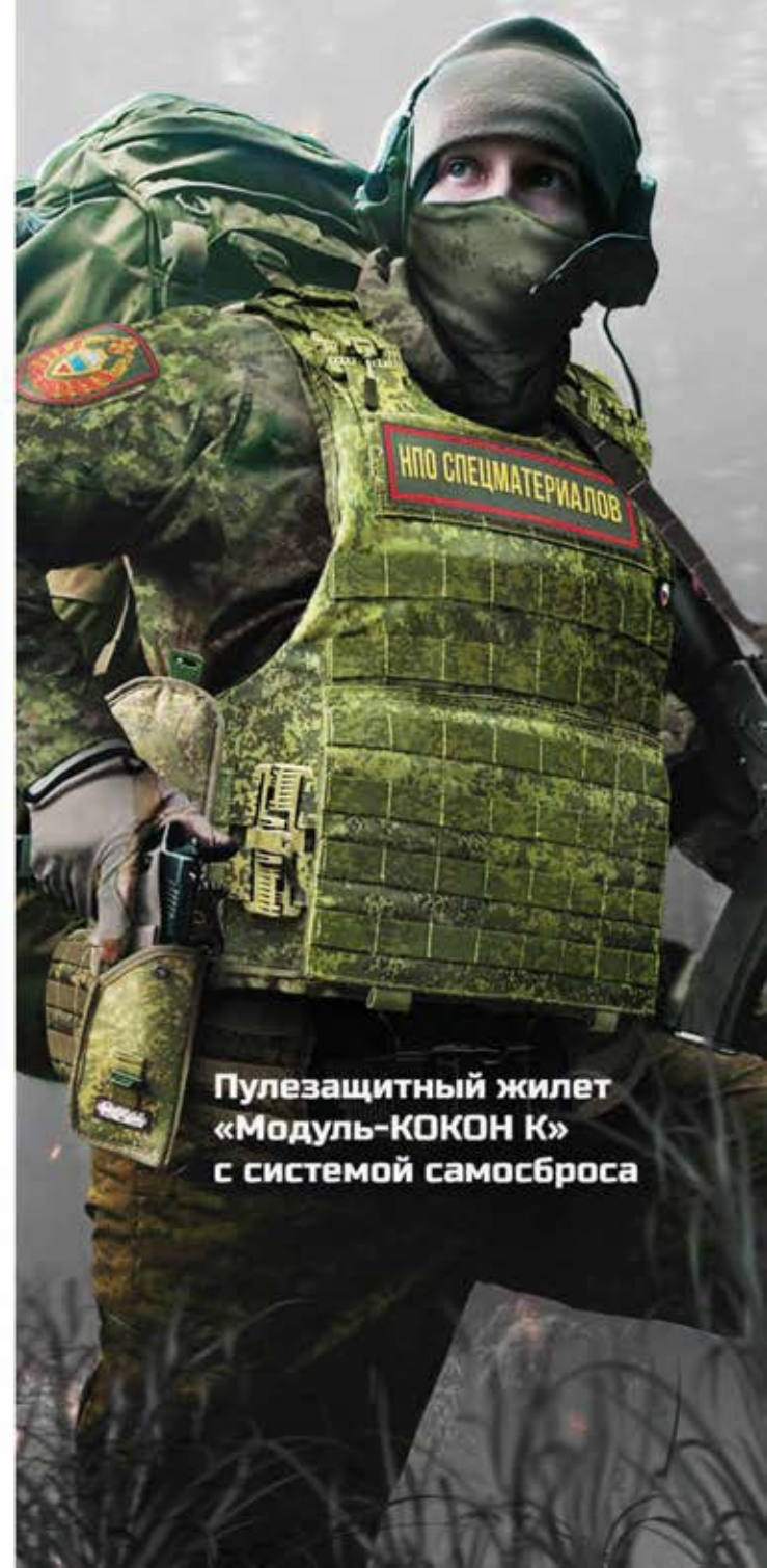
Пулезащитный жилет «Модуль-КОКОН К» с системой самосброса