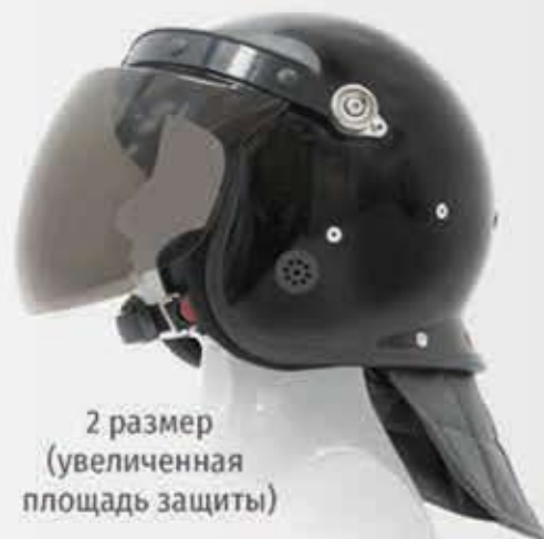
2 размер (увеличенная площадь защиты)